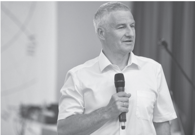
Артур Парфенчиков.

В республике прошел Национальный молочный конгресс