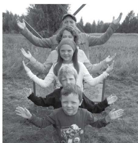
Семья Мироновых.

Общая сумма поддержки превысила 4 млн рублей