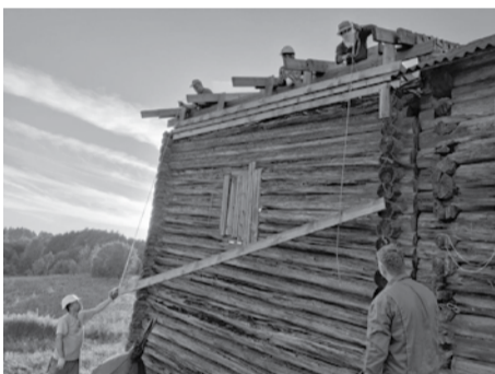
Фото: Общее Дело. Возрождение деревянных храмов Севера

Завершены консервационные работы в храме великомученицы Параскевы Пятницы в деревне Онежены