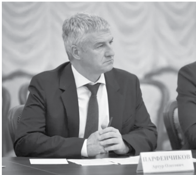
Артур Парфенчиков.

Заседание провели помощник президента России Николай Патрушев и полпред президента в Дальневосточном федеральном округе Юрий Трутнев