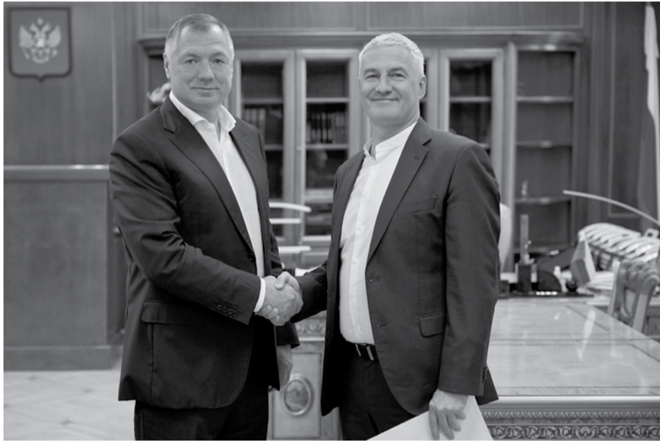
Марат Хуснуллин и Артур Парфенчиков.

Глава Карелии Артур Парфенчиков обсудил с заместителем председателя правительства России Маратом Хуснуллиным реализацию инфраструктурных проектов в республике