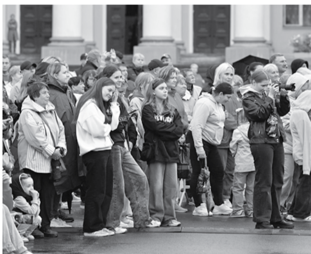
Зрители на концерте.