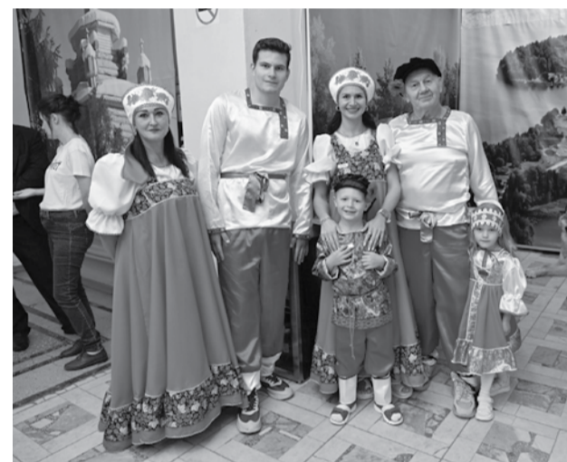
Семейный праздник.

Весь год региональные и муниципальные власти готовились к празднованию Дня Карелии. В Сегеже благоустроили городские общественные пространства, отремонтировали историческое здание центральной библиотеки, открыли отдел МФЦ и секцию по карате