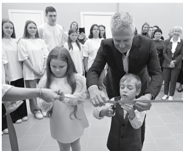
На открытии библиотеки.