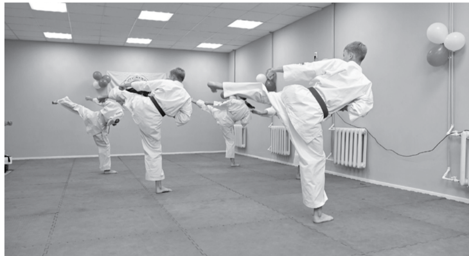
Юные «росомахи».