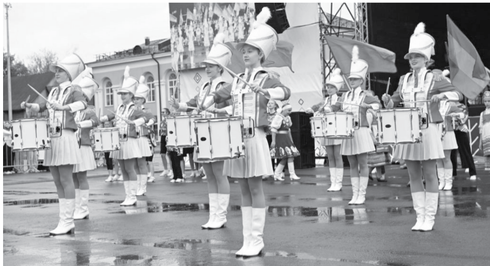
На концерте в честь Дня республики.