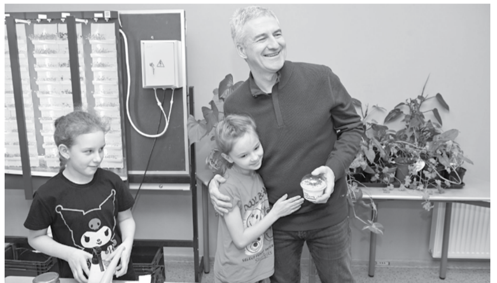
Артур Парфенчиков.