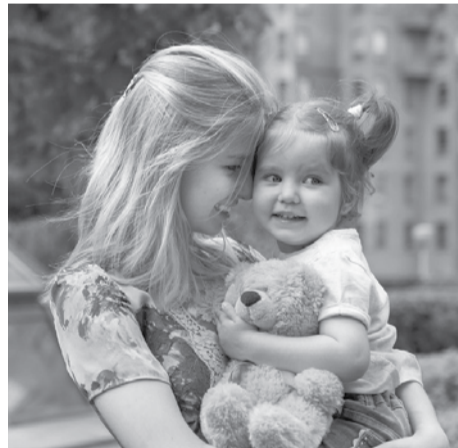
Право на единовременную денежную выплату будут иметь постоянно прожива-