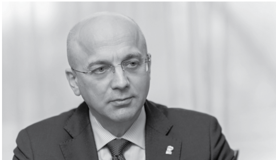
Элиссан Шандалович.

На период выполнения задач в зоне СВО Элиссан Шандалович будет исполнять полномочия спикера парламента на непостоянной основе