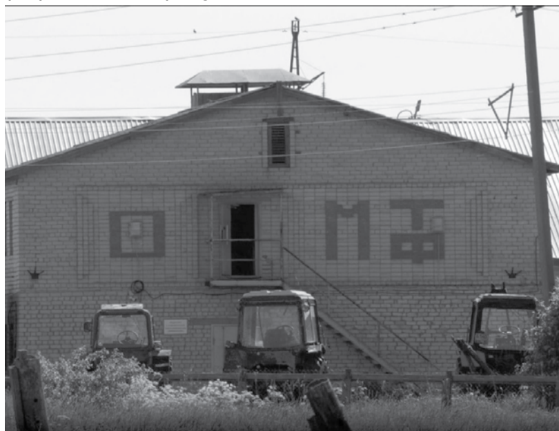
Ферма в Янишполе.

Уже осенью того же года рядом с молочной фермой «Янишполе» обнаружили свалку мертвых животных. Гниющие трупы коров лежали на землях лесного фонда и сельскохозяйствен-