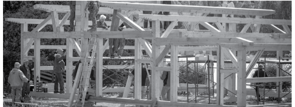
Фото: «Наша жизнь – Meijän eläigu»

Раньше мастера изготавливали такие лодки вручную по своим собственным чертежам