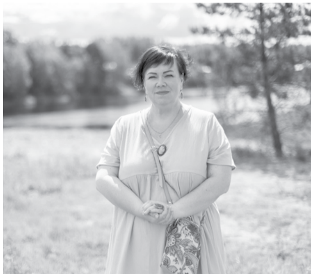
Светлана Хребетова.