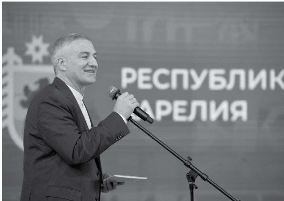
Артур Парфенчиков.

8 июня Карелия встретила свой 105-й день рождения. К праздничной дате «НК» проанализировала, как Карелия развивалась со дня празднования своего столетия