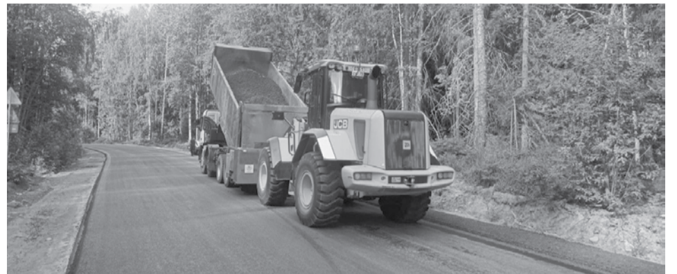
Ремонт дороги Видлица – Кинелахта – Ведлозеро.

С начала 2025 года на дорожную сеть республики выделили на 1 млрд рублей больше, чем за аналогичный период прошлого года