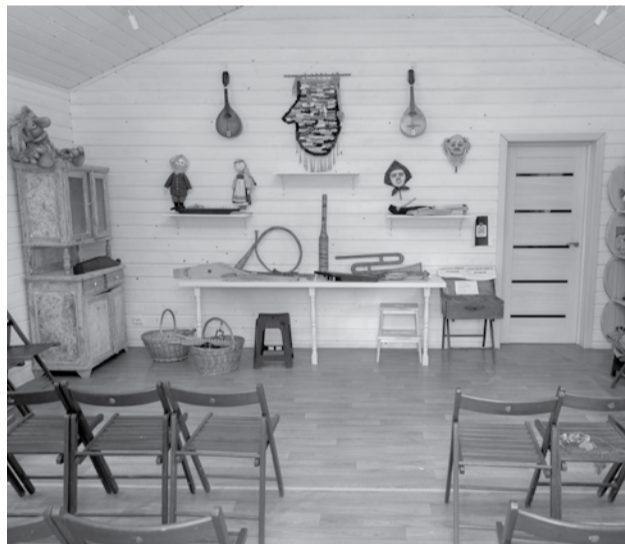
Музей в Киндасово.