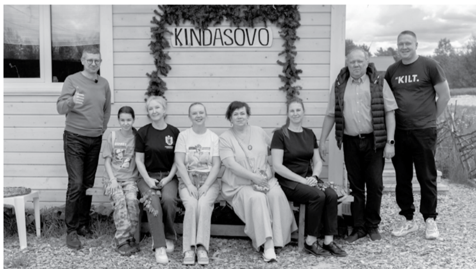
В Киндасово.

В преддверии серии совещаний по развитию туризма вице-спикер парламента Карелии Ольга Шмаеник и председатель комитета по экономической и промышленной политике, энергетике и ЖКХ Леонид Лиминчук побывали в деревне Киндасово, которая ежегодно принимает тысячи туристов