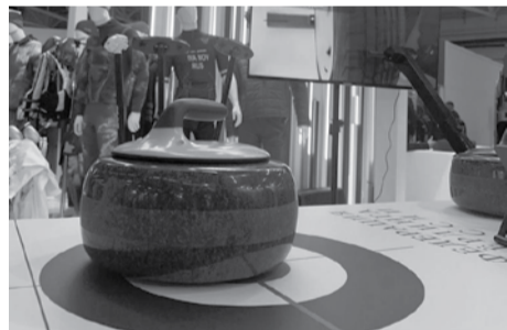
Карельский камень для керлинга

Сейчас идет процесс проверки тестовых образцов камней из Карелии