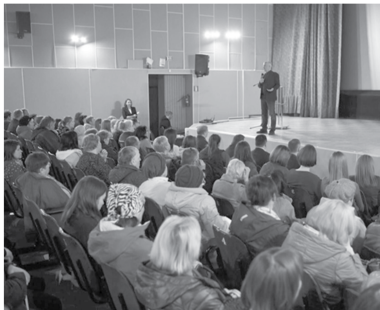
На встрече с жителями Суоярви.

Об этом глава Карелии Артур Парфенчиков рассказал на встрече с жителями Суоярвского округа