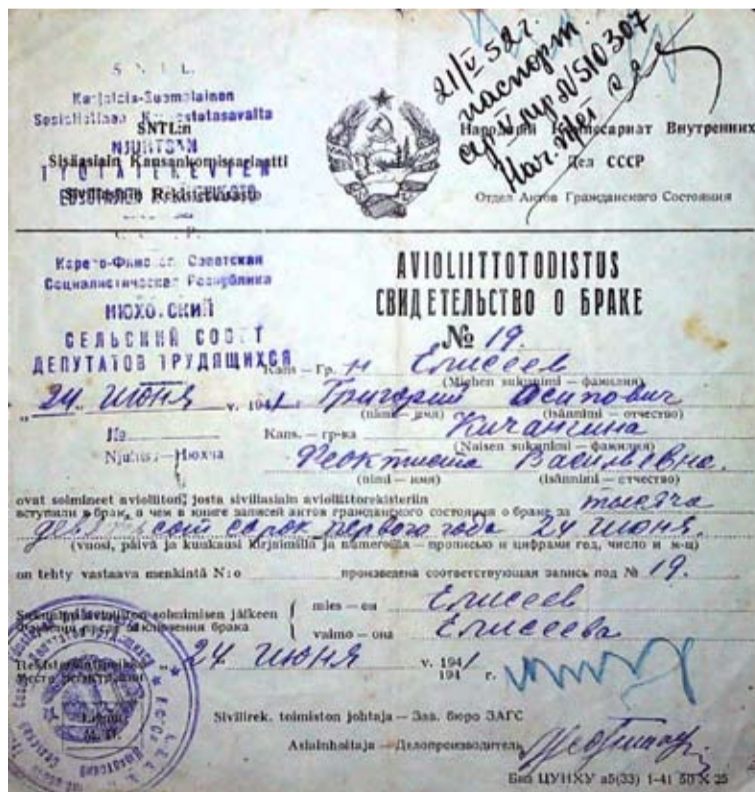
Свидетельство о браке 24.06.1941