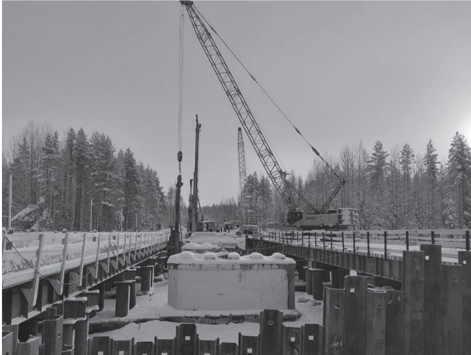
Мост через реку Шуя.

Ремонт проведут по нацпроекту «Безопасные качественные дороги»