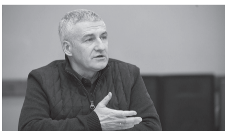
Артур Парфенчиков.

Работы пройдут по федеральной целевой программе развития Карелии, которую продлили по поручению президента РФ Владимира Путина