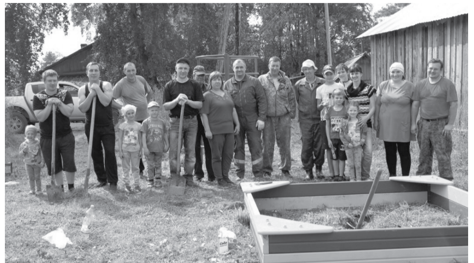
Жители поселка Лендеры.

Муезерский район благодаря статусу приграничной территории получит федеральную поддержку. Дополнительные средства пойдут на развитие многих ключевых направлений. Прежде всего это транспортная доступность, улучшение жилищных условий, здравоохранение, образование и социальная сфера. Субсидии на эти цели выделит федеральный центр.