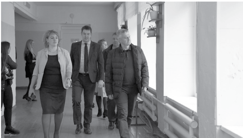
Артур Парфенчиков в Муезерской школе.