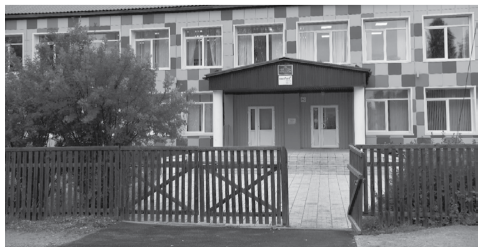
Школа в поселке Муезерский.

Напомним, что в минувшем году возобновил работу физиокабинет в межрайонной больнице № 1 в Муезерском. Также в учреждение закупили необходимое медицинское оборудование. Для нужд населения заказали стационарные аппараты для ультразвуковой терапевтической и УВЧ-терапии, стационарные и портативные аппараты для местной дарсонвализации (воздействия на поверхностные ткани и слизистые оболочки организма человека импульсными токами высокой частоты) и гальванизации (воздействия на организм постоянным электрическим током малой силы и малого напряжения), аппараты для магнитотерапии, массажный стол и медицинскую мебель.