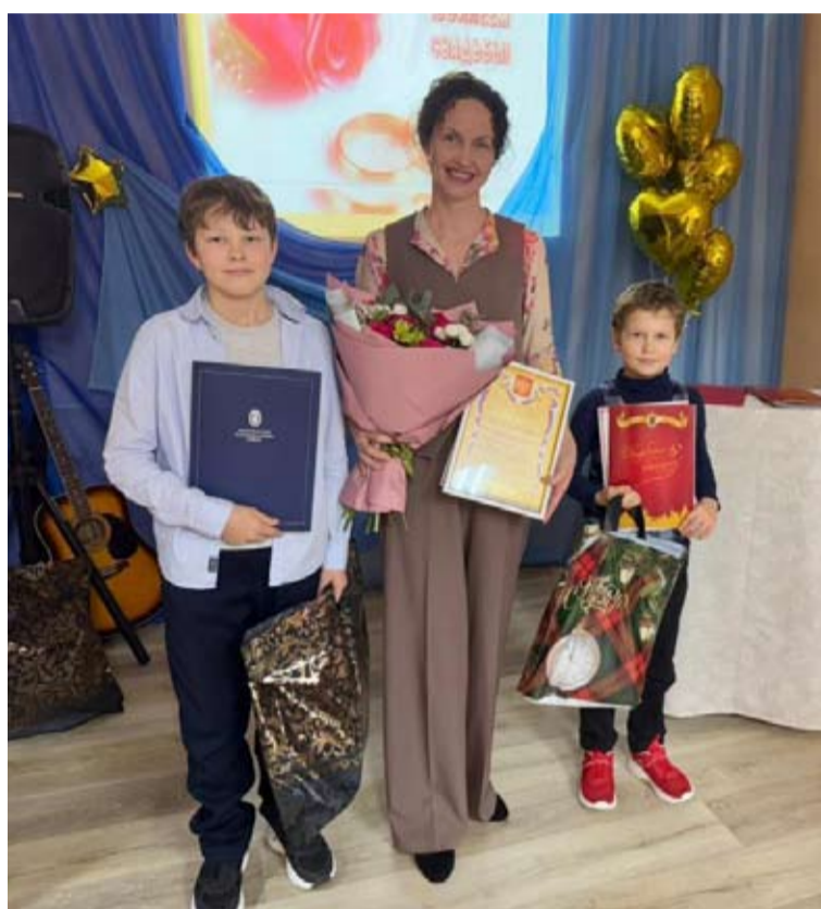
Поздравление участников конкурса «Семья года»

Помимо этого отдел ЗАГС продолжает проводить работу по разъяснению семейного законодательства среди учащихся школ района. За год специалисты провели лекции для учеников Шуйской школы на тему «Семейные ценности», «Функции органов ЗАГС», «История войны в актах гражданского состояния».