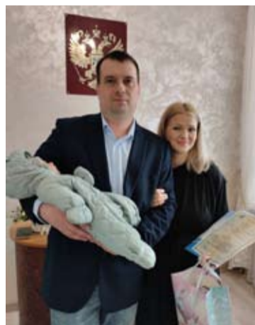
Торжественная регистрация рождения

Напоминаем, граждане могут подать заявление о государственной регистрации актов гражданского состояния и совершении юридически значимых действий