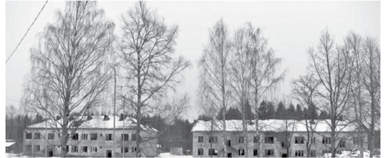
Аварийные дома на улице Победы.

Ремонт водозабора и строительство котельной – ключевые проекты 2025 года в городе